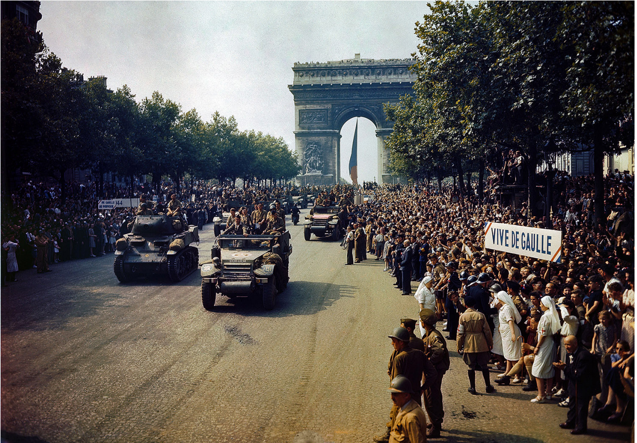
Oddziały francuskiej 2 Dywizji Pancерnej przejeżdżają pod Łukiem Triumfalnym. 26 sierpnia 1944 roku