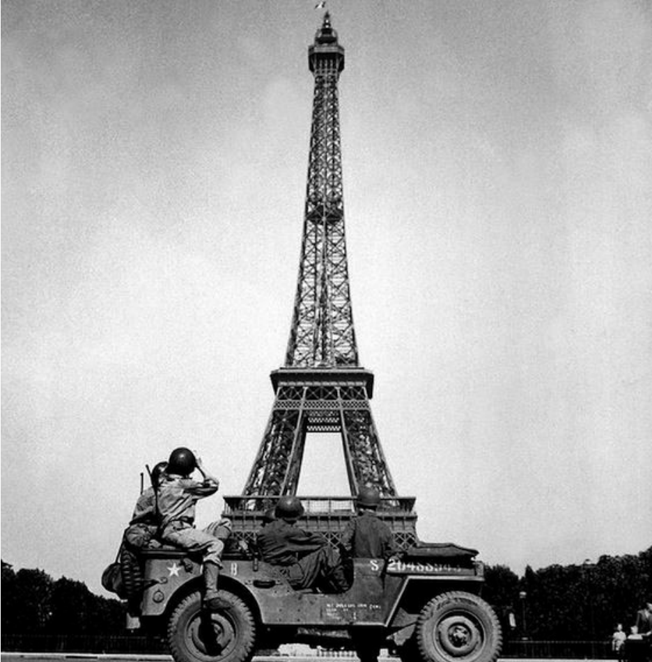
Amerykańscy żołnierze obserwują francuską flagę na Wieży Eiffla. 25 sierpnia 1944 roku