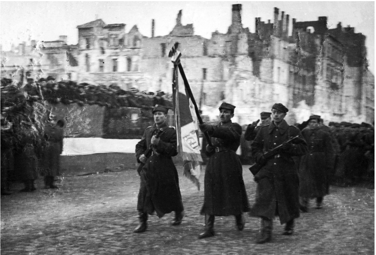
Defilada 1 Armii Wojska Polskiego na ulicy Marszałkowskiej w Warszawie. 19 stycznia 1945 roku