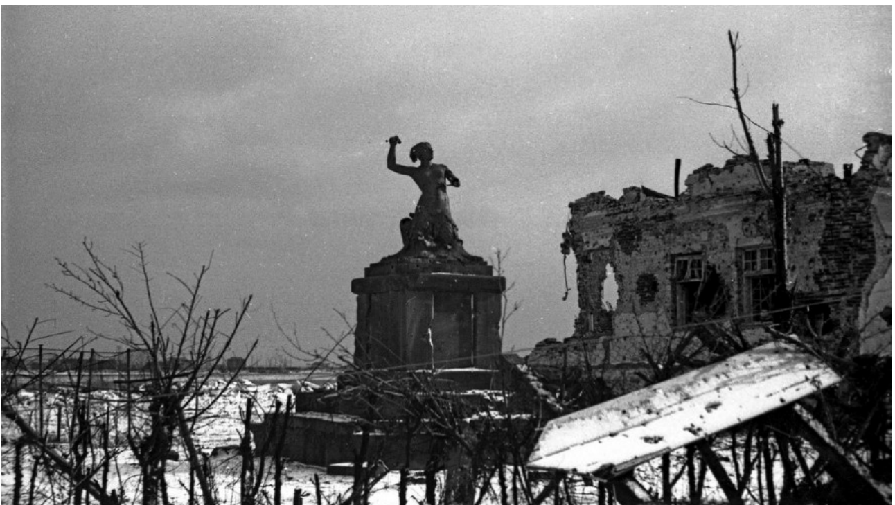
Warszawa, zniszczony pomnik Syrenki. Styczeń 1945 roku